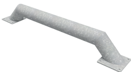
Naprowadzacz AMTR-N PROSTY

Naprowadzacz stalowy AMTR-N PROSTY ma długość 1840 mm. Rama stanowiąca jego szkielet i stopy wykonane są z okrągłych profili stalowych o średnicy 159 mm. Całość przytwierdzona jest do podstaw kwadratowych wykonanych z blachy płaskiej.