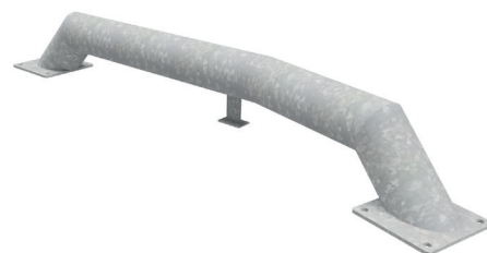
Naprowadzacz AMTR-N ŁAMANY

Naprowadzacz stalowy AMTR-N PROSTY ma długość 1840 mm. Rama stanowiąca jego szkielet i stopy wykonane są z okrągłych profili stalowych o średnicy 159 mm. Całość przytwierdzona jest do podstaw kwadratowych wykonanych z blachy płaskiej.